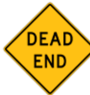
この先、行き止まり