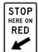
赤信号時はここで停止せよ