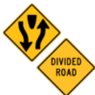
この先、道路分岐あり