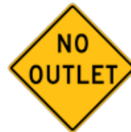
この先、抜け道なし