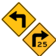
この先、矢印方向に(25マイル)曲がり角あり