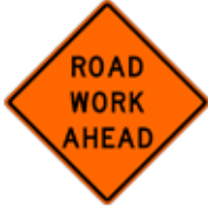
この先、道路工事あり