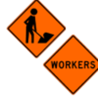
この先、道路工事作業員あり