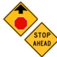
この先、"(一時)停止"あり