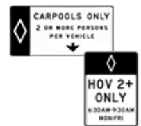
2人以上同乗時のみ使用可能車線(カープools/HOV)