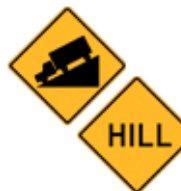
この先、谷(急な坂)あり