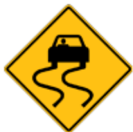
この先、路面が(濡れている時)滑りやすい