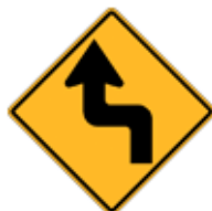
この先、(→左→右)逆曲がり角あり