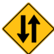
この先、対面(両面)通行道路あり