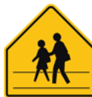
この先、学生・児童の横断(歩行)あり