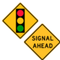
この先、信号機あり