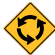
この先、円形(環状)交差点あり