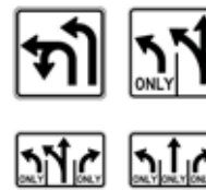
(複数車線の場合)矢印方向のみ進入可能