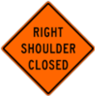
この先、右路肩閉鎖あり