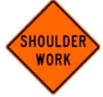
この先、路肩工事あり