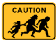
この先、フリーウェイ横断者(歩行者)あり