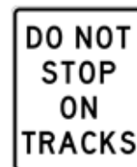
線路内の停止禁止