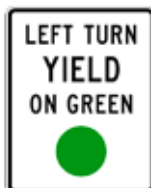
青信号時は左折車は(先行権を)ゆずれ