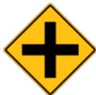
この先、十字路あり