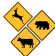
この先、動物の飛び出しあり