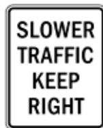
低速車は右車線走行を維持せよ