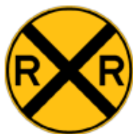
この先、鉄道の踏切あり