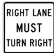
右車線は右折せよ