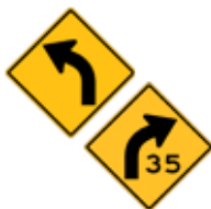
この先、矢印方向に(35マイル)カーブあり