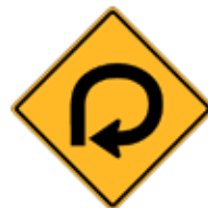
この先、270°回転カーブあり