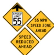
この先、(55マイルに)減速せよ