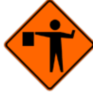
この先、交通規制係員あり