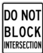
交差点内の封鎖妨害禁止