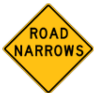
この先、道路幅が狭くなる