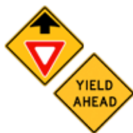
この先、"ゆずれ"あり