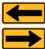
一方向(矢印方向)のみ進入可能