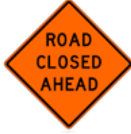
この先、道路閉鎖あり