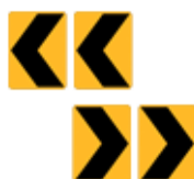
この先、矢印方向に屈折あり