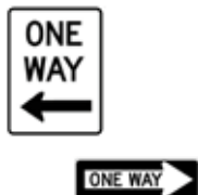
矢印方向に一方通行