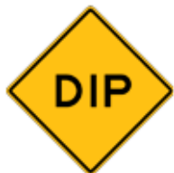
この先、速度制限の凹(DIP)あり