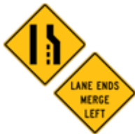
この先、(右)車線の減少あり、(左)に合流せよ