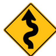
この先、曲がりくねりあり