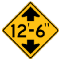
この先、高さ制限あり(12フィート6インチ)