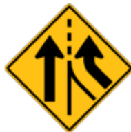
この先、車線の増加あり