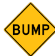
この先、速度制限の凸(BUMP)あり