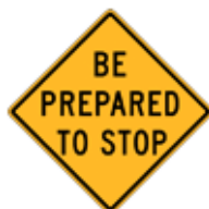
この先、停止する準備をせよ