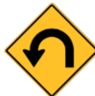
この先、ヘアピンカーブあり