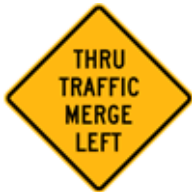
直進車は(左)に合流せよ